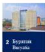
2 Бурятия Buryatia Команды участники