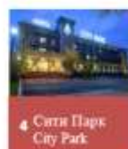
4 Сити Парк City Park Команды участники