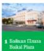
1 Байкал Плаза Baikal Plaza Официальная гостиница чемпионата