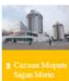
3 Сэлэнгэ Мөрөн Selenge Muren Команды участники